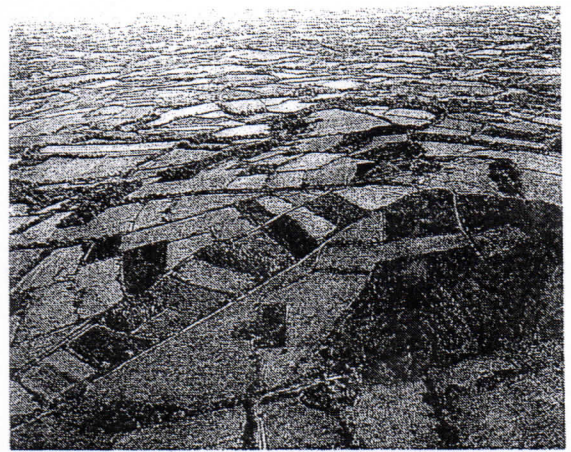
Doc. 2: Paysage de bocage breton.

Les ruraux ( les gens ) sont peu nombreux dans les campagnes.