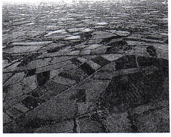
▲ Doc. 1 : Paysage de champs ouverts dans la Beauce.